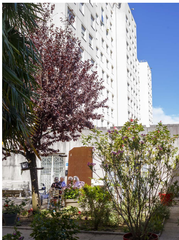
Atelier Fanzine intergénérationnel avec l'EHPAD MAdelaine Caille