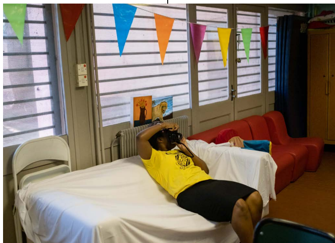
© collectif item - Atelier Fanzine intergénérationnel avec le centre HUDA - Forum Réfugiés / Paloma Laudet